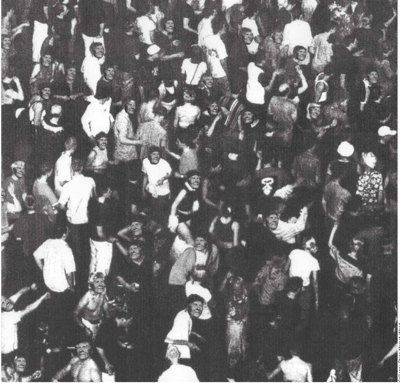
Collage : China Marsot-Wood