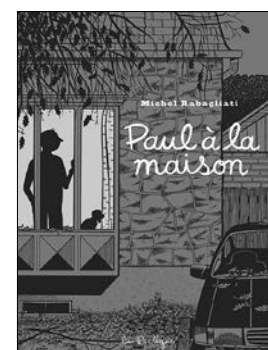
Michel Rabagliati Paul à la maison Montréal, La Pastèque 2019, 208 p., 31,95 $